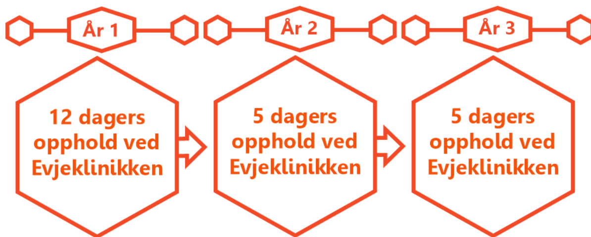
Figuren illustrerer behandlingstilbudet for barn og unge

Familiene innkalles til et 12-dagers opphold det første året, så to 5-dagers opphold etter henholdsvis ett og to år. Behandling skjer i form av et gruppetilbud med omtrent 15 deltakende familier som inviteres i spesifiserte uker i skolens sommerferie.